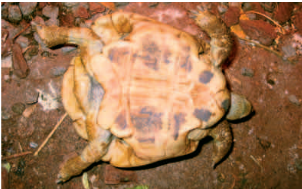
Fig. 3. En rask skildpadde, der lægges på ryggen, skal selv kunne vende sig igen, hvis underlaget ikke er for glat. Denne græske landskildpadde har ingen problemer med at vende sig.