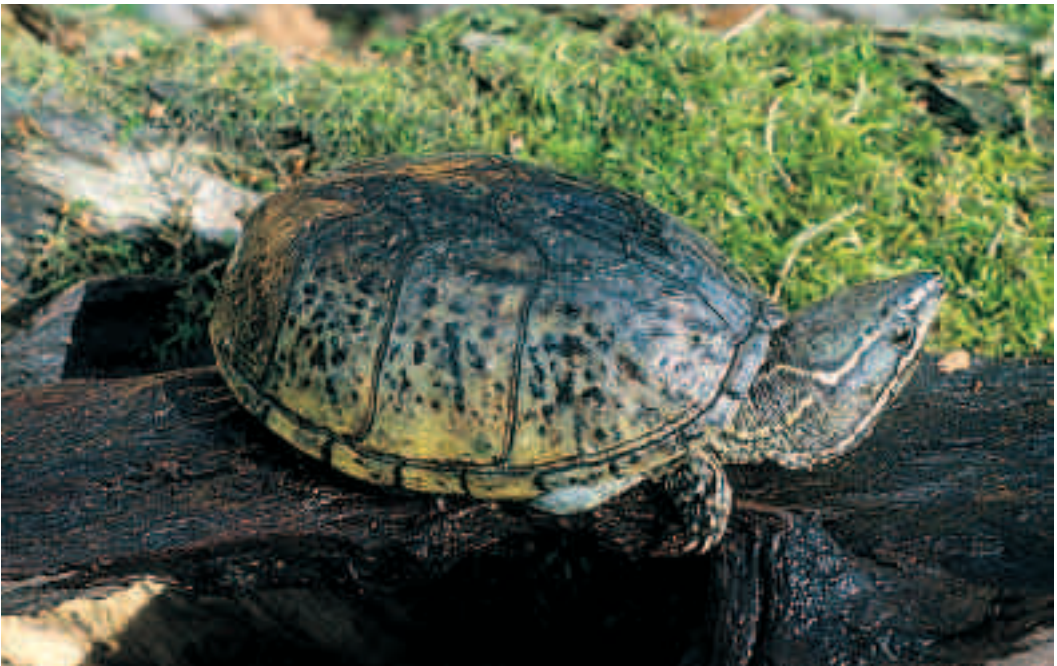
Fig. 8. En moskusskildpadde, Sternotherus odoratus , er et godt terrariedyr, da den ikke bliver så stor og ikke er en aktiv svømmer.