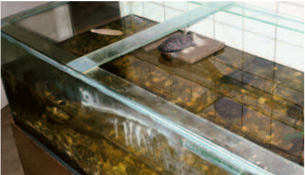
Fig. 12. Et udsnit af et permanent anlæg til sumpskildpadder. Det er rummeligt, og et effektivt filter sørger for rensning af vandet. I vandoverfladen til venstre i billedet flyder en sepiaskal, som skildpadder kan gnave af og således få nyttig kalk.