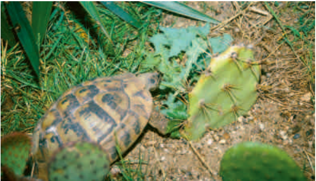
Fig. 4. En græsk landskildpadde er i fuld gang med at æde i sit udendørs anlæg. Langt det sundeste foder er vilde urter som f.eks. mælkebøtter. Her er det den udmærkede foderplante svinemælk, der står på menuen!