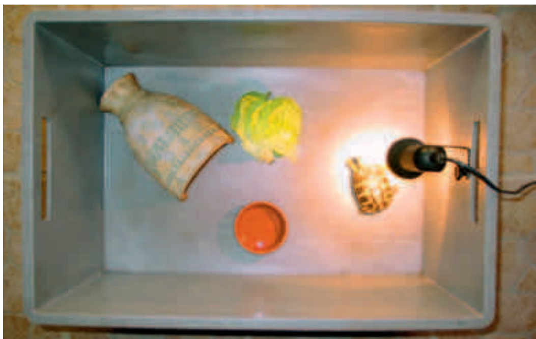
Fig. 2. En helt steril boks til at holde en lille landskildpadde i karantæne. Her vil du straks kunne opsamle en lille afføringsprøve, som en dyrlæge kan undersøge for parasitter og sygdomme.