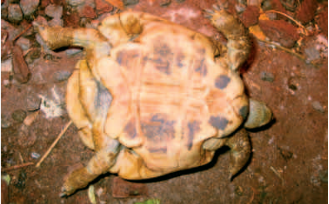
Fig. 3. En rask skildpadde, der lægges på ryggen, skal selv kunne vende sig igen, hvis underlaget ikke er for glat. Denne græske landskildpadde har ingen problemer med at vende sig.