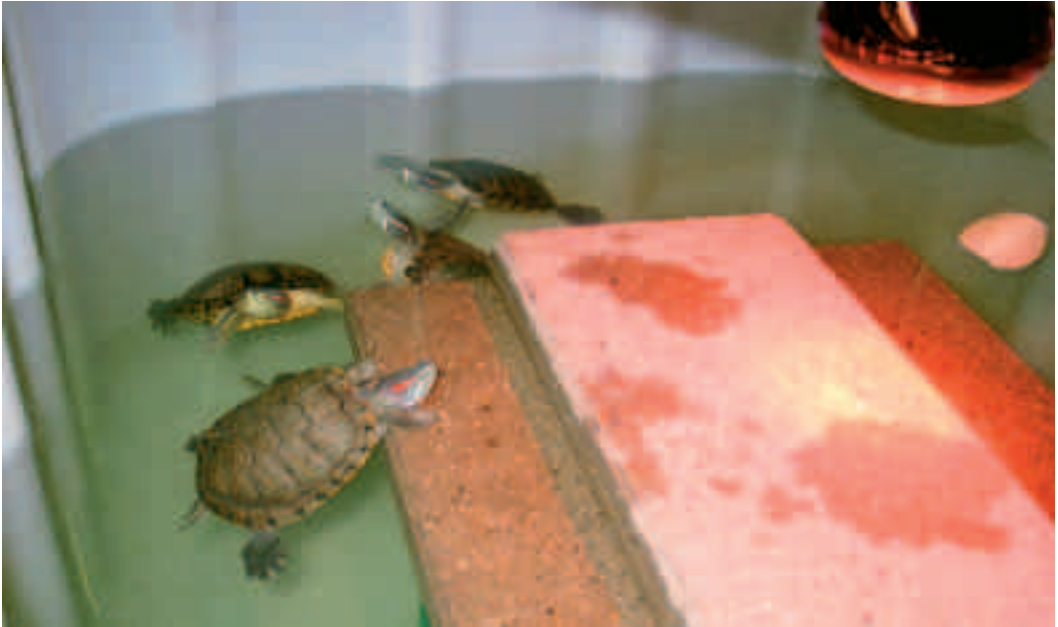
Fig. 11. En meget simpel beholder til karantæne af sumpskildpadder. De rødørede terrapiner, som ses på dette billede, kan kravle op på stenen for at sole sig. Den kraftige varmelampe giver den fornødne varme under »solbadningen«, men vandet skal også opvarmes af et varmelegeme.