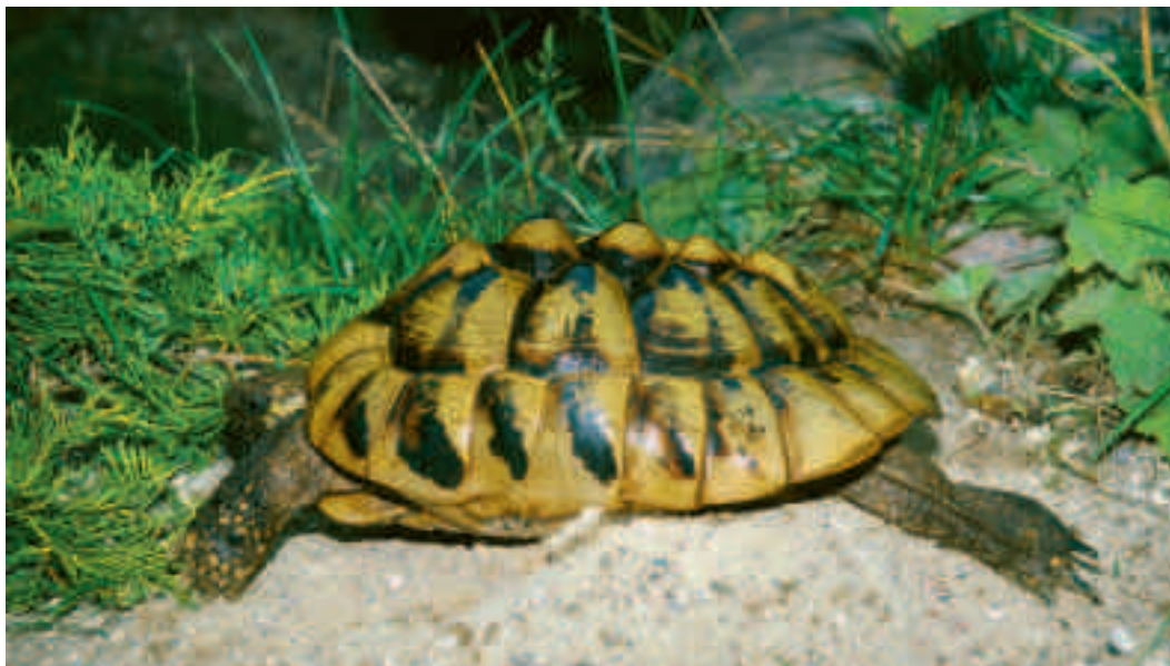
Fig. 1. Et tydeligt eksempel på en landskildpadde, der er blevet fodret forkert over længere tid. Dette er en græsk landskildpadde, Testudo hermanni, som har udviklet et deformt skjold. Under vækset er det blevet meget fladt, og de enkelte skjoldplader har udviklet små »pukler«.