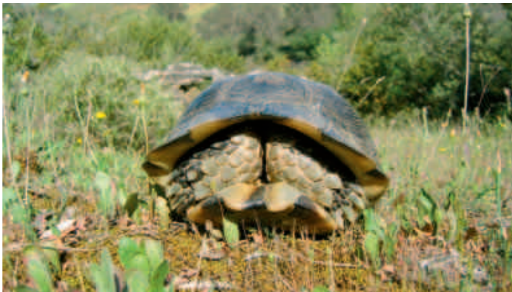
Fig. 5. Skildpadder er effektivt beskyttede bag deres panser! Og det er ikke kun skjoldet, der yder dem beskyttelse, men deres skællede og armerede forben udgør også en vigtig beskyttelse af hovedet! Dette er en bredrandet landskildpadde, Testudo marginata, fotograferet i naturen.