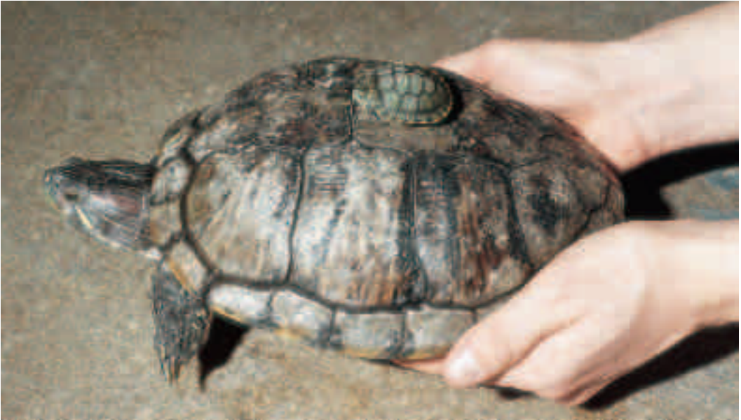
Fig. 7. Sumpskildpadder sælges tit som helt små unger. Du skal vide, at de vokser sig meget store og skal have megen plads! På dette billede af to rødørede terrapiner ses en unge sammen med en voksen hun.