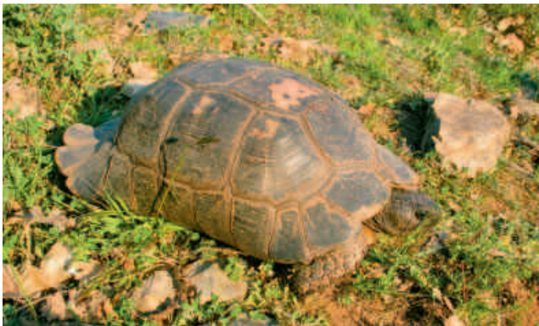
Fig. 6. Du skal ikke lade dig narre af, at forskellige skildpaddearter kan have ganske forskellig skjoldform. En bredrandet landskildpadde, Testudo marginata, har (som navnet siger) rande, der buer udad. Det er helt normalt.