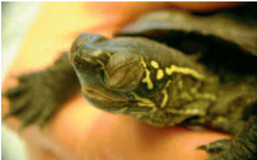
Fig. 9. Hvis en sumpskildpadde har ophovnede øjne med en form for skorpe eller pus (dødt cellemateriale), så lider den af mangel på vitamin A.