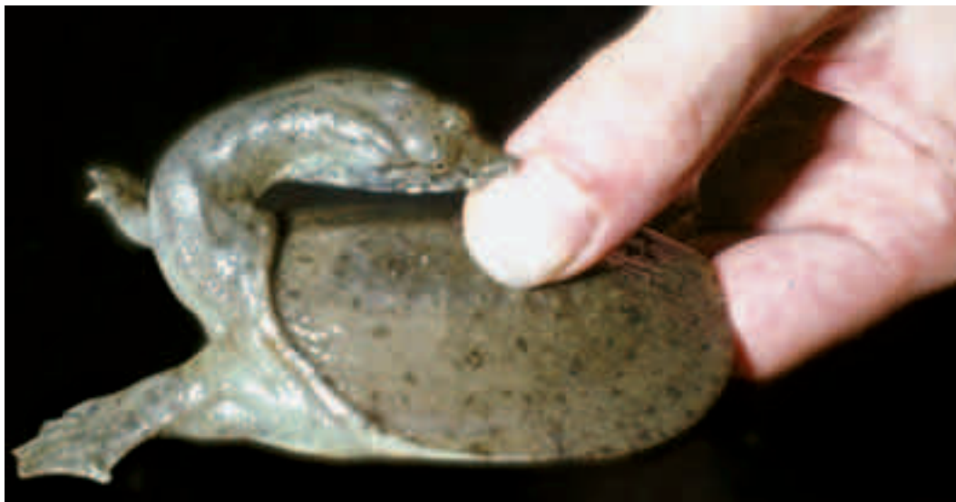
Fig. 10. Mange vandlevende skildpadder kan bestemt godt bide fra sig, selvom de måske lader til at have et roligt gemyt! På billedet har en lille blødschildpadde stynget sin lange hals ud og har bidt sig fast i en tommelfinger – og det gør ondt! Skildpadden holdes faktisk korrekt, men tommelfingeren burde have været anbragt lidt længere tilbage på rygskjoldet. Blødschildpadder er kendt for at være aggressive, også over for artsfæller.